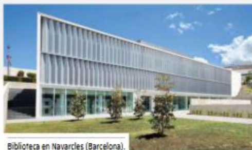
Biblioteca en Navarres (Barcelona).