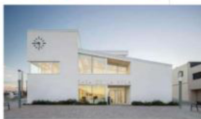
Ayuntamiento en Castellvi de la Marca (Barcelona).

de la Casa Museo, Arts (Barcelona) | Biblioteca en el Casino Borrás, Castellbell i el Vilar (Barcelona) | Adecuación de paso a nivel y acondicionamiento de camino, Masquefa (Barcelona) | Parque de agua en el Parc Europa, Santa Perpètua de Mogoda (Barcelona) | Ampliación nave industrial Denso Barcelona, Sant Fruitós de Bages (Barcelona).