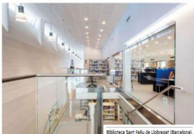
Biblioteca Sant Feliu de Llobregat (Barcelona).