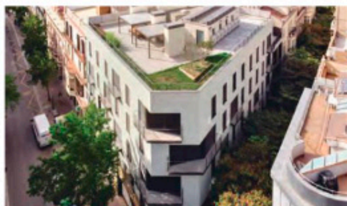
Edificio Guimerà, Manresa, Barcelona