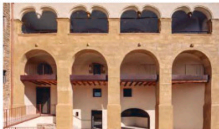
Rehabilitación Casa Fàbregas, Manresa