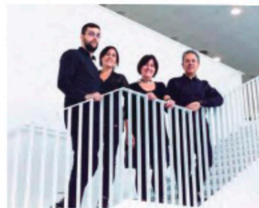
Equipo Santamaria Arquitectes

PASSEIG DE LA REPÚBLICA N° 18 1º 3ª 08241 - MANRESA (BARCELONA) t. 938727926 Facebook: Santamaria-Arquitectes / Instagram: santamaria_arquitectes / Linkedin:santamaria-arquitectes info@santamariaarquitectes.cat www.santamariaarquitectes.cat