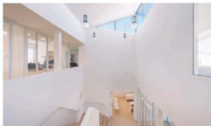
Ayuntamiento en Castellví de la Marca, Barcelona