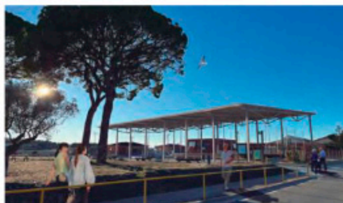
Cubierta de la pista polideportiva en Oleróla, Barcelona