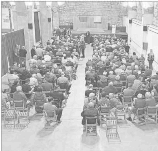
L'assemblea es va fer al Museu de l'Aigua i el Tèxtil