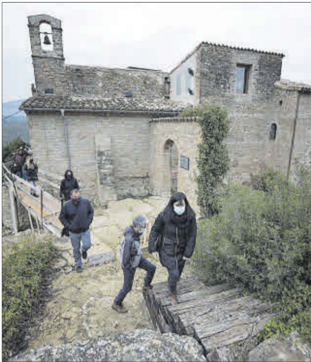
Visita d'obres, ahir, amb els monuments al fons