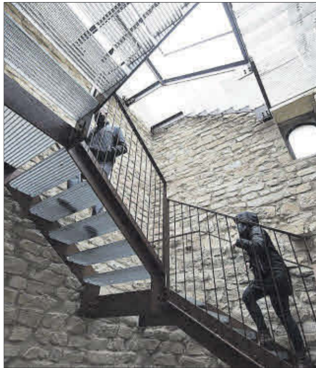
Les escales dins la torre, que serà un mirador