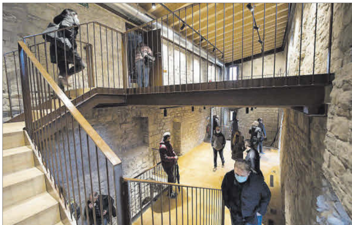
La casa de l'ermità, amb tres nivells, serà un museu per explicar l'origen de Castellet i l'entorn

► S'ha completat la reforma de l'ermita, la casa de l'ermità i la torre, les principals estructures del complex, que ara es museïtzaran per fer-les visitables d'aquí a un any, i s'adequaran els murs perimetrals per seguretat