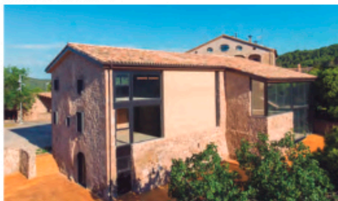
Rehabilitación casa el Prat, Gaià (BCN)