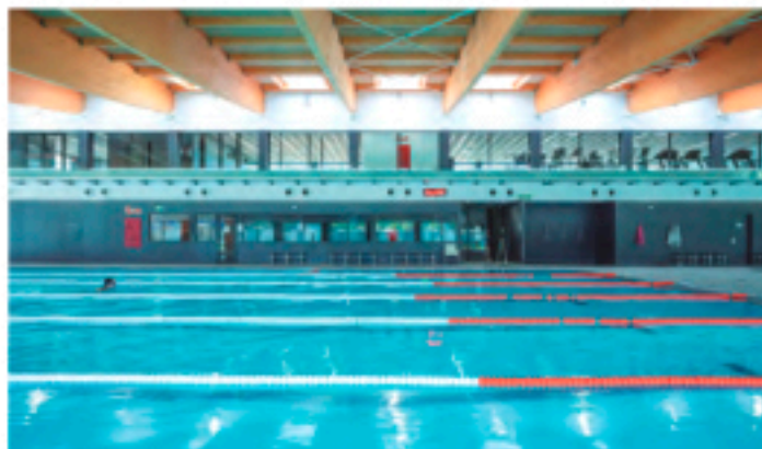
Piscina cubierta, Masquefa (BCN)