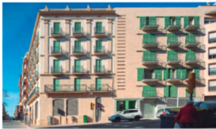
Rehabilitación Casa Alter i Edificio Anexo, Manresa (BCN)