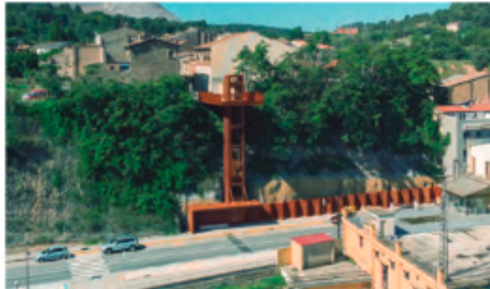
Ascensor público, Sallent (BCN)