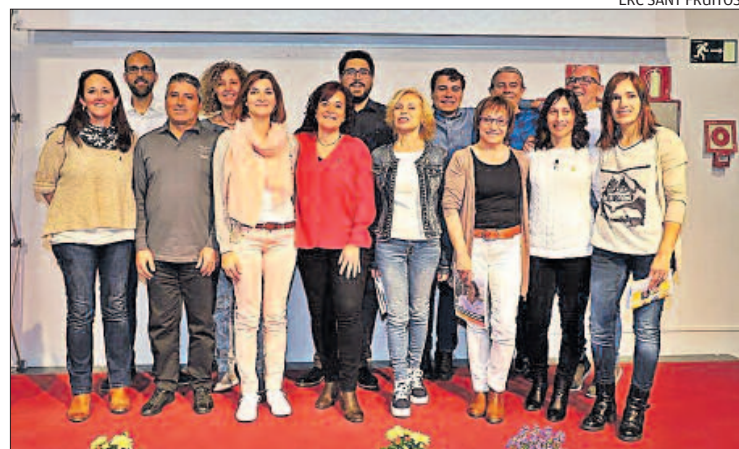
Els membres de la candidatura d'ERC de Sant Fruitós a les municipals