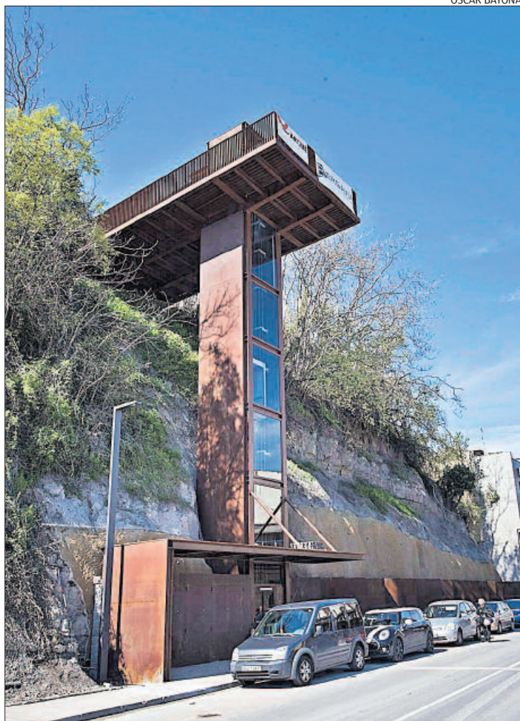
El nou ascensor ha canviat la fisonomia d'un tram de la carretera

D'altra banda, també s'ha condicionat la base de la torre perquè serveixi de parada de bus en sentit sud. S'ha fet una estructura «integrada amb l'entorn i que té continuïtat» des de l'ascensor fins a