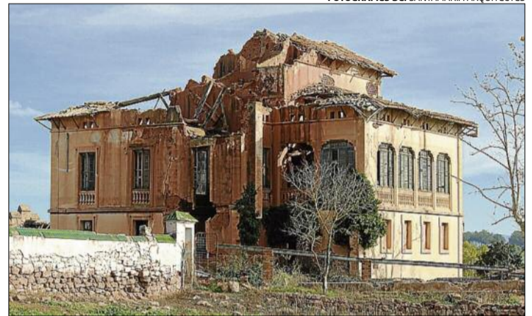
La torre per la banda mirant cap a Montserrat, en un estat lamentable