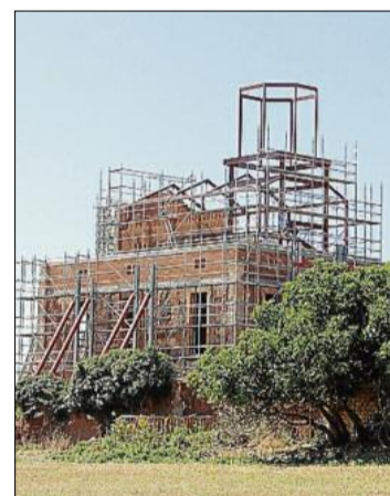
L'estructura per fer les obres