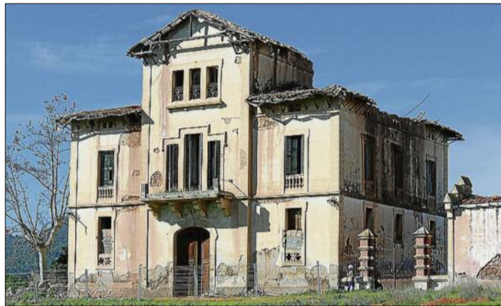
Estat de l'edifici d'Ignasi Oms i Ponsa mirat d'esquena a Montserrat