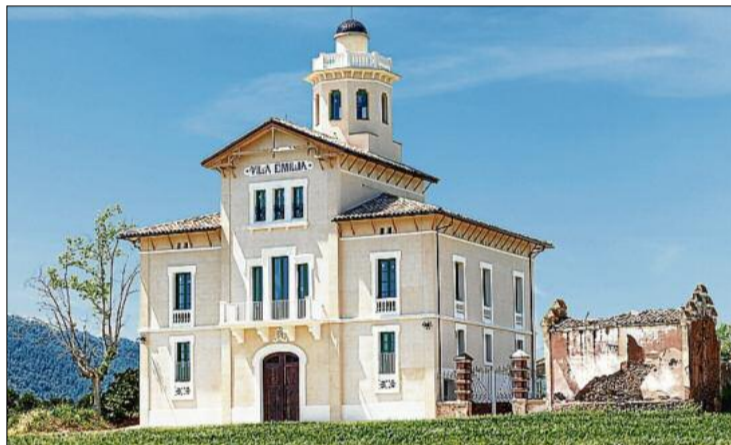
La mateixa perspectiva de dalt una vegada realitzada la restauració