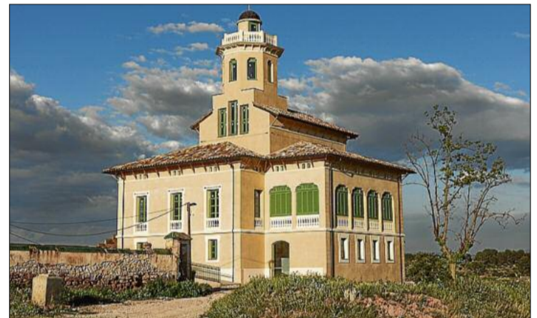
L'edifici situat al camí de Rajadell amb l'aspecte final fetes les obres