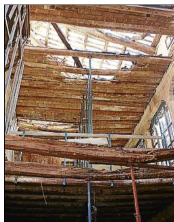
Interior de l'edifici apuntalat