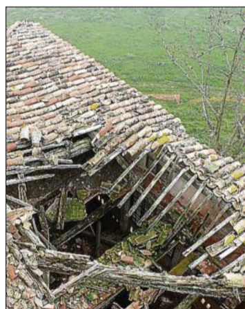
Un tros de sostre esfondrat