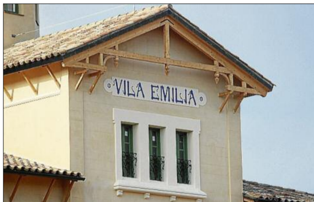
La inscripció de Vil·la Emília a la façana, com era coneguda