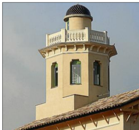
La nova torrassa que hi han aixecat