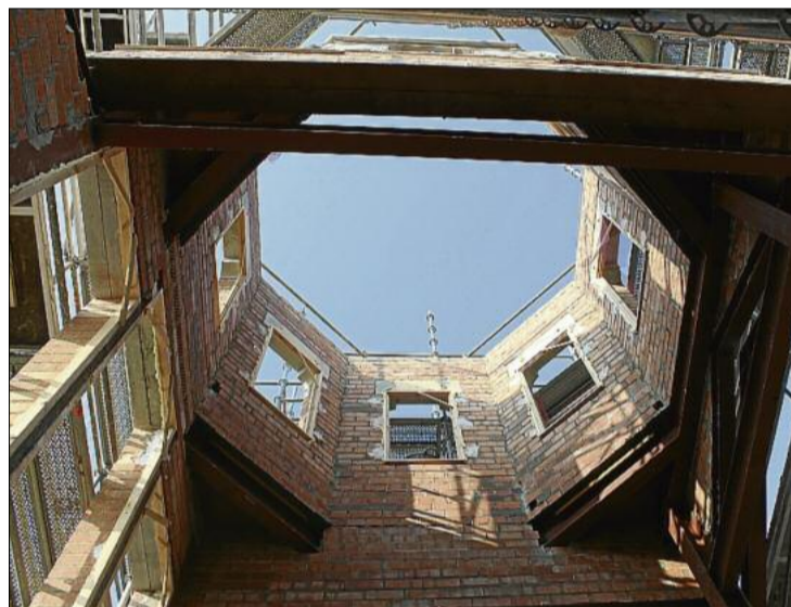
La torrassa que estan construint al capdamunt vista per dins