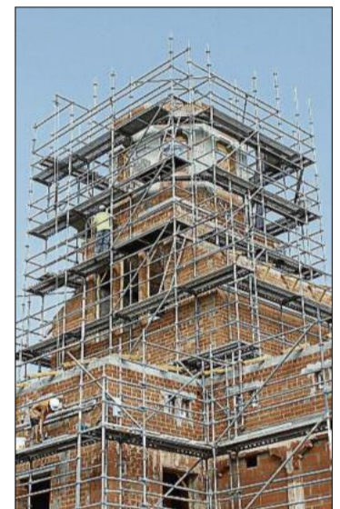
La part de dalt de la torre