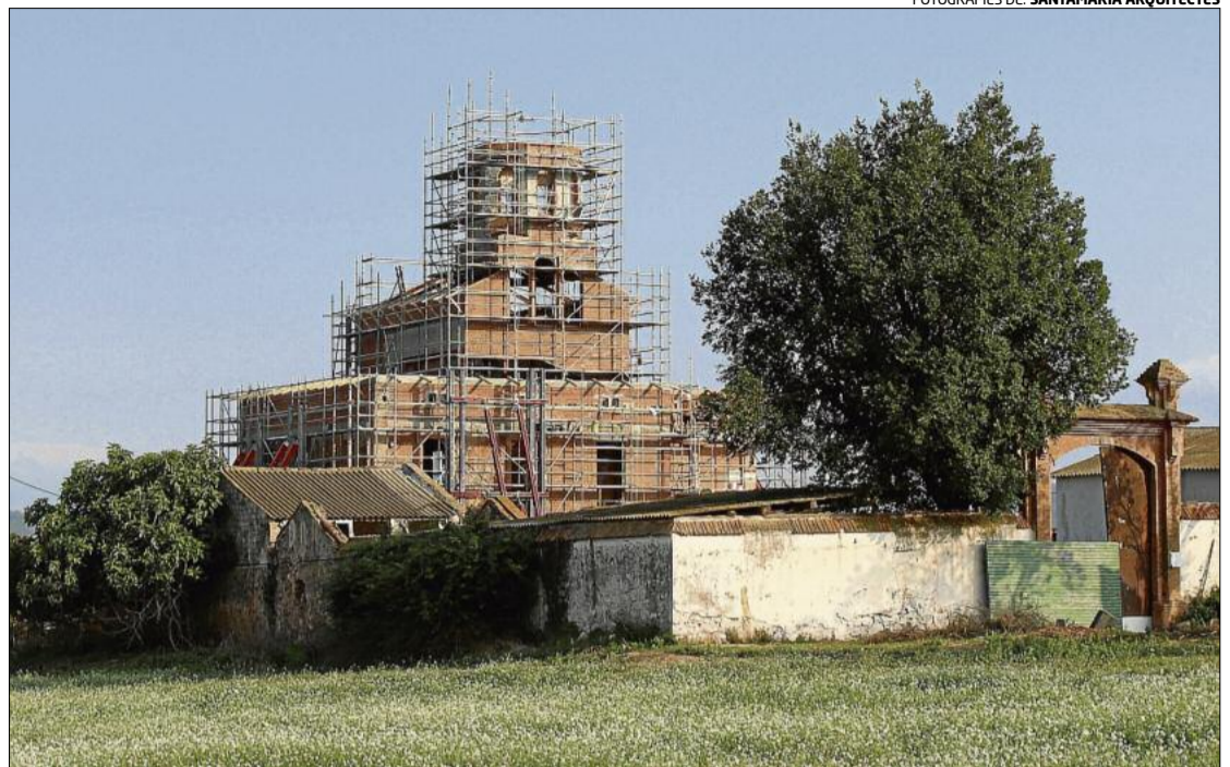
Una imatge recent de la torre Lluvià, de la qual va començar la reconstrucció el febrer passat