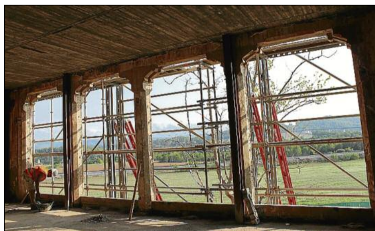
Les obertures de la construcció deixen veure el paisatge que l'envolta