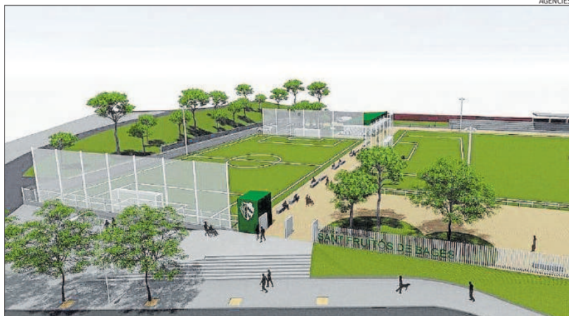
Imatge virtual de la remodelació prevista de l'entorn del camp de futbol fruitosenc

► Es faran unes noves instal·lacions de serveis i una entrada accessible