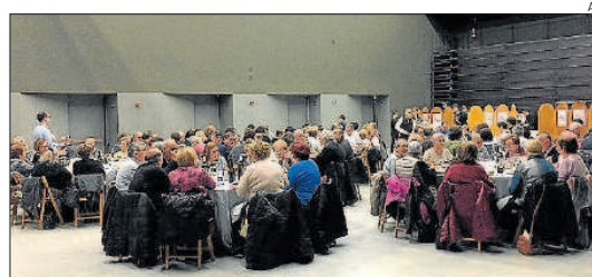
L'apat va reunir més de cent persones al recinte de Cal Carrera

A la pista exterior pavimentada s'hi construirà una graderia, i a l'antiga zona de petanca s'hi farà mig camp de bàsquet pavimentat. Aquestes millores s'executaran per fases i s'iniciaran durant el 2018.