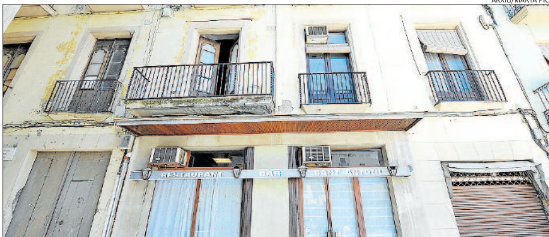
Part de la façana de l'antiga Fonda de Sant Antoni, a la banda dreta de la plaça Major, veïna de l'ajuntament