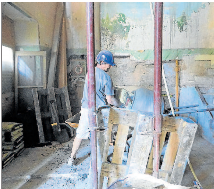
Un operari treballant a la planta baixa de la Casa Fàbregas

Acabada aquesta fase, en la qual també es deixarà preparada la caixa per, en el futur, poder-hi instal·lar un ascensor, encara en caldran d'altres en l'àmbit estructural amb la finalitat de poder fer habitable la construcció.