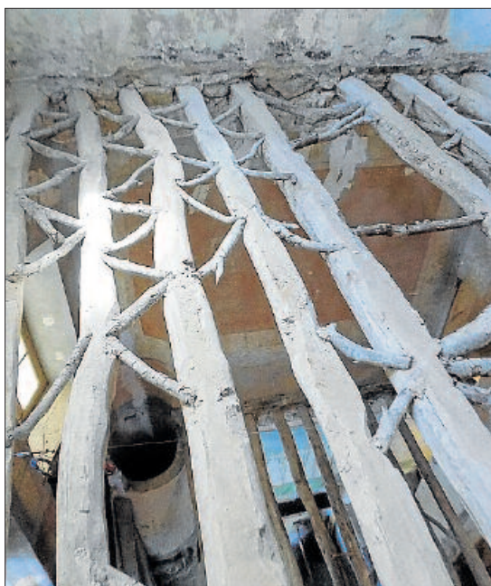
El sistema constructiu per fer els sostres