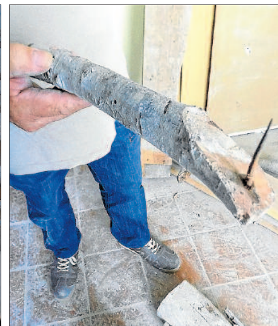
Les branques es clavaven a la biga de fusta amb claus