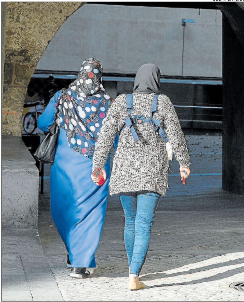
Dues persones novingudes al Barri Antic de Manresa