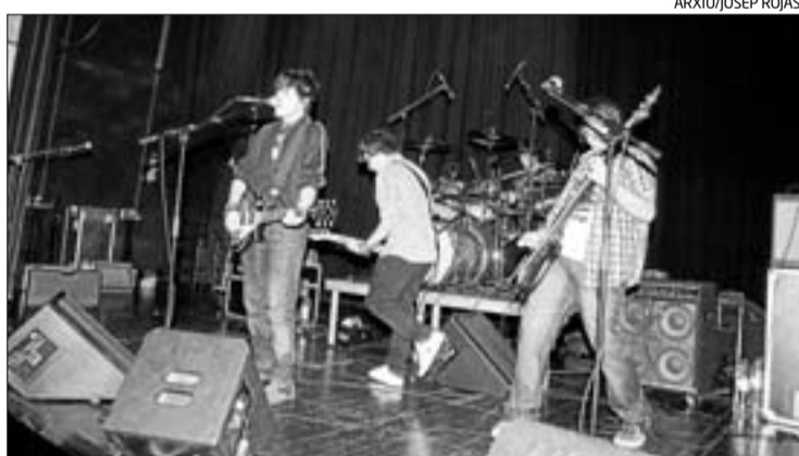
Actuació del grup Suite a la 1a edició del Fruits Rock, l'any passat