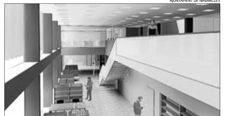
Una imatge virtual de l'interior de la futura biblioteca municipal

La futura biblioteca, que ha de substituir la que actualment hi ha ubicada sobre l'ambulatori, es distribuirà entre les dues plantes inferiors. La part baixa tindrà accés des de la plaça que dona al carrer de Mura, i encabirà la biblioteca infantil i les zones d'informació i préstec. A la primera planta, on es podrà accedir des de l'avinguda de