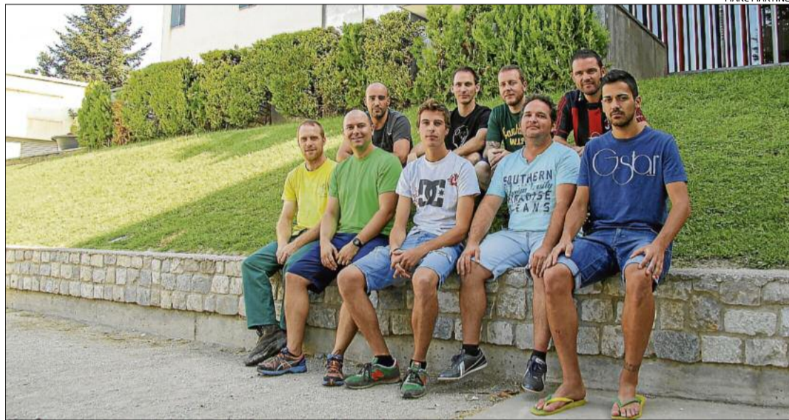
Els membres de la nova entitat a la zona de darrere l'ajuntament, on es faran tots els actes de presentació

Un bon exemple del tarannà que volen transmetre el trobem en el que serà el seu primer acte oficial, que es farà aquest dijous, 10 de setembre, coincidint amb els actes institucionals de la Diada. La intenció dels joves és «enriquir» els actes que ja s'organitzen habitualment (com ara l'ofrena al monument de Rafael Casanovas o la ballada de sardanes) amb noves propostes que es complementin, que tinguin atractiu i que siguin capaces de captar un públic més heterogeni i d'un ventall d'edats més ampli. Així, «volem començar forts», amb un acte visual (la mos-