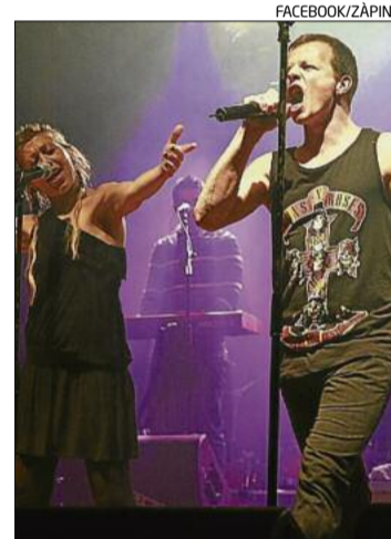
Zàping, en una actuació recent