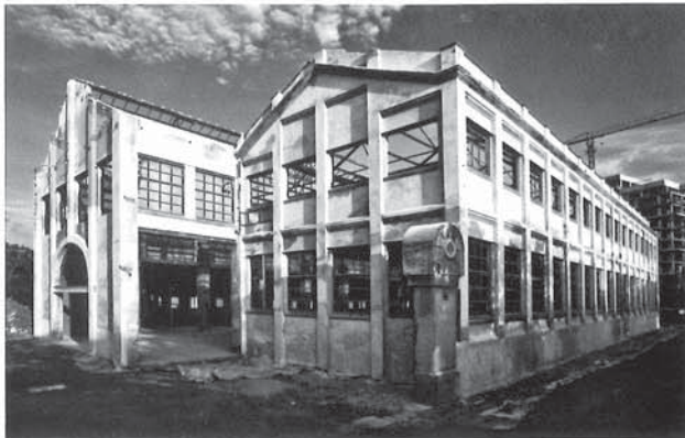
Museu d'història de Barcelona a la fàbrica Oliva Artés.

El Poblenou era el districte manufacturer que va ser l'àrea d'expansió industrial de Barcelona del segle XVIII al XX. L'equipament es troba dins del Parc Central del Poblenou, l'antiga àrea suburbial molt dinàmica en els darrers segles, que va acollir els prats d'indianes al segle XVIII i va formar el major districte industrial de Barcelona des de mitjans del segle XIX a mitjans