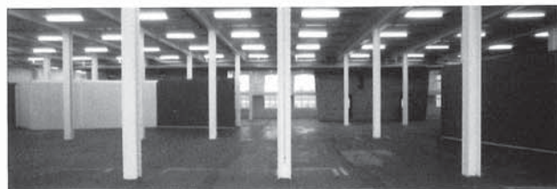
Interior de la nau.

ció definitiva de l'espai a curt termini. Aquest procés va funcionar com a banc de proves.