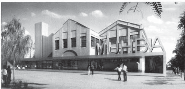
Museu d'història de Barcelona a la fàbrica Oliva Artés.

ren un accés nou pel Carrer d'Espronceda. Tot i la recessió de la postguerra, l'empresa va recuperar amb el nom de Tallers Oliva Artés, l'any 1940, i disposava d'un segon taller construït al sector nord-oest de la parcel·la, cap a la prolongació de el carrer Ali Bei (ara carrer del Marroc). El taller va patir successives obres de reformes posteriors i ampliacions condicionades per la disponibilitat de solar, fins que, durant els anys 60, l'empresa va iniciar una crisi que acabaria amb la suspensió de pagaments, al 1978. Després va continuar com a cooperativa constituïda per antics treballadors (TOACSI, Tallers Oliva Artés Societat Cooperativa Industrial), fins al tancament definitiu, al 2000.