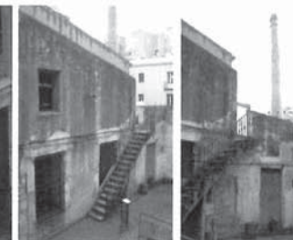
L'estat original presentava un estat d'abandonament molt important, amb múltiples patologies estructurals.