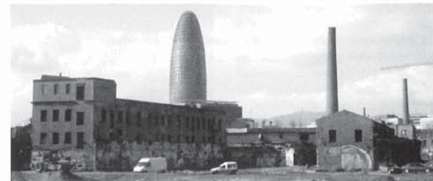
Part del complex industrial.

Als segles XVIII-XIX, els terrenys agrícoles que se situaven al nord de Barcelona van ser objecte d'un gran canvi a causa de la revolució industrial. A l'antic barri del Poble Nou es trobava el motor productiu de la ciutat i hi conviuen múltiples recintes industrials. Va arribar a ser tan important la zona industrial que era anomenada popularment com la "Manchester catalana". A finals del s. XVIII, el complex propietat de la família Framis va dedicar la seva activitat a la indústria de la llana. El complex industrial de Can Framis va ser un dels primers a instal·lar-se ocupant, aleshores, la superfície equivalent a quatre illes de l'Eixample i estava format per diversos edificis. Anys després, quan es va traçar la trama Cerdà, el complex Framis va passar a una cota inferior, a causa de la nova rasant d'aquest pla, i quedà enfonsat i esbiaixat respecte dels seus carrers adjacents. Al cap dels anys, va anar perdent la seva activitat i va passar a l'oblit. A diferència d'altres fàbriques, protegides pel Catàleg Patrimonial de la ciutat de Barcelona, a Can Framis no es va valorar cap interès arquitectònic, ja que es va projectar pensant més en la seva funcionalitat que no pas en els aspectes estètics. Això va passar amb gran part de les indústries del Poble Nou que tenien construccions