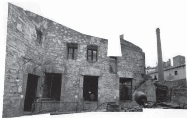
Rehabilitació de "La Seca" com a espai escènic.

En els darrers anys, el patrimoni industrial de Catalunya ha sofert una transformació d'ús molt important, fet que ha provocat en els equipaments usos diferenciats dels originals. A continuació, s'exposen quatre casos d'edificis obsolets i abandonats que, amb els nous usos, han revitalitzat els propis edificis i els seus entorns propers.