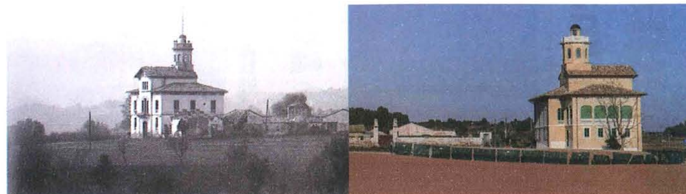
La torre Lluvià de l'arquitecte manresà Ignasi Oms i Ponsa en el seu estat original i després de la primera fase de la rehabilitació.