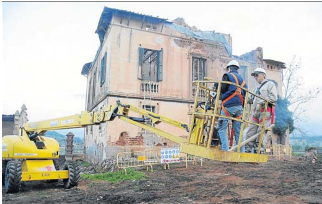
Dos operaris a la cistella de la màquina elevadora per poder arribar a la coberta de la torre

► L'actuació inclou la retirada de runa, l'estintolament, l'aixecament de plànols i una diagnosi de l'estabilitat estructural