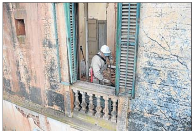
Feina de desenrunament des del primer pis de la residència