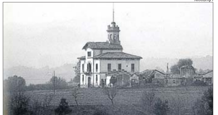
Una fotografia d'arxiu de la propietat quan encara tenia formes