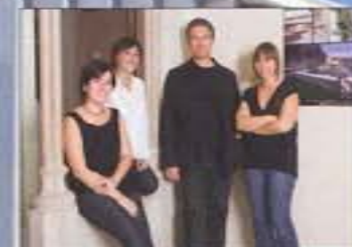
Equipo Santamaría Arquitectes

LA EFICIENCIA PARA UNA ARQUITECTURA POLIVALENTE