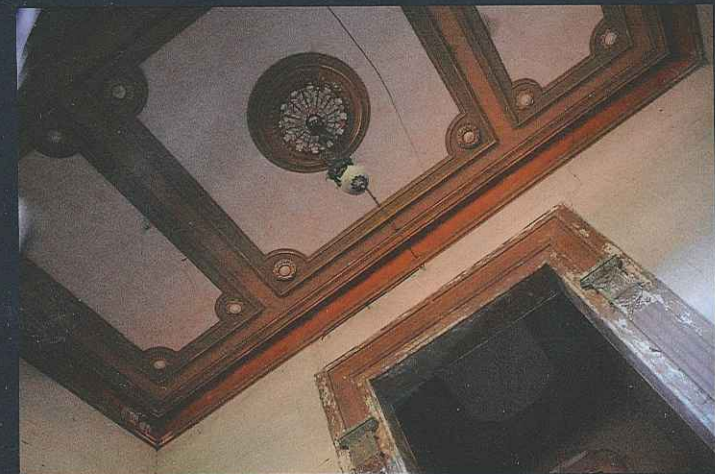
Detalls de la casa que avui encara es conserven. A la dreta, vista actual de la casa, que ja ha perdut la torre original i part del cos central.