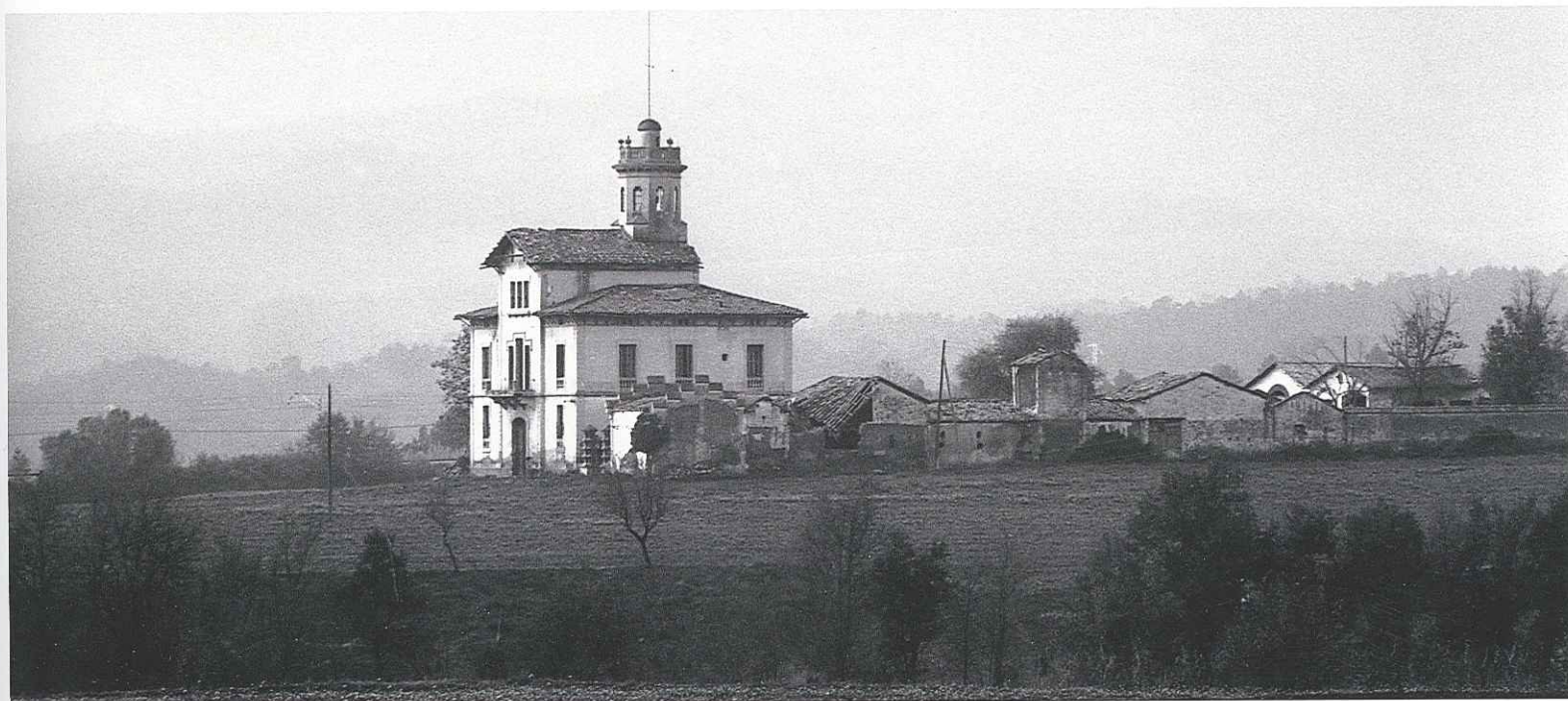
Vistes de la Vil·la Emília o Torre Lluvià quan encara es mantenia l'estructura de l'edifici i del conjunt, i restava dempeus la torre.

La torre s'aixeca, aïllada, al bell mig de camps de conreu, al paratge del Suanya, al sud de Manresa, i té una orientació nord-sud. Dels dos costats parteix el mur de tanca perimètric que dóna lloc a un recinte ampli, on es generen, a la part posterior de la casa, l'era i diverses edificacions annexes ordenades al voltant d'un pati (magatzem, garatge, estable, bassa i les altres dependències d'ús agropecuari). La tanca té tres entrades, una al sud, l'altra a ponent i la tercera al nord, totes tres diferents quant a forma i decoració. L'edifici principal (l'habitatge pròpiament dit) és de planta quadrangular i està format per diversos cossos: un de central, de planta baixa i dos pisos, i dos de laterals i gairebé simètrics, de planta baixa i pis. El que dóna a ponent té una galeria al primer pis, configurada per una seqüència d'obertures en arc deprimat i mixtilini, tancades amb persianes de fusta de llibret mòbil i tarja vogida amb motius geomètrics i vegetals.